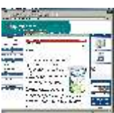
"Nutral lança dieta após alta hospitalar". Para ver esta matéria na íntegra, visite o site: www.hospitalar.com/not_int.php3?n=204&c=12&s=A