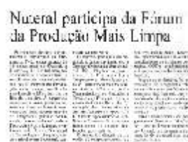
Jornal "Diário do Nordeste" Caderno Negócios 01/07/2002