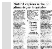
Jornal "Diário do Nordeste" Caderno Economia 04/06/2002 - Fortaleza-CE